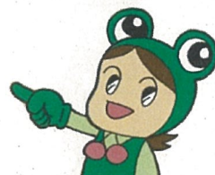
県消費生活センター キャラクター “ケロちゃん”

全国で新聞の訪問販売に関する相談について、この 10年間、毎年約1万件前後の消費者苦情 が寄せられているよ。契約者の平均年齢は年々高くなっていて、 高齢者のトラブルが問題化 しているんだ。注意してケロ！