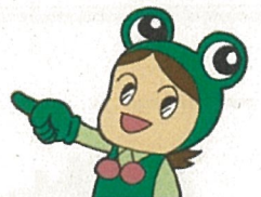
県消費生活センター キャラクター “ケロちゃん”